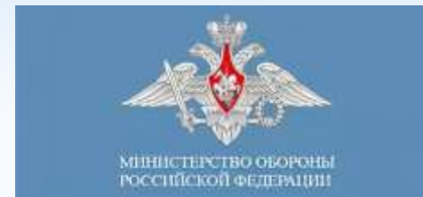
Министерство обороны РФ